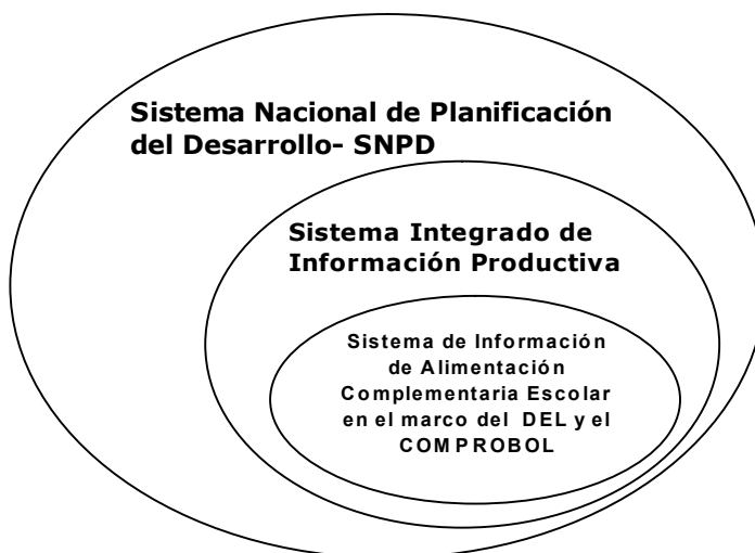
Figura 1. Integración del Sistema de Información de ACE en el marco del DEL y el COMPROBOL, en el SNPD